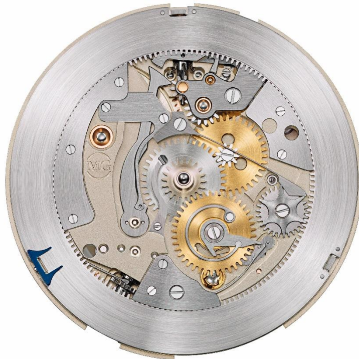
Kaliber 100.3 Zifferblattseite